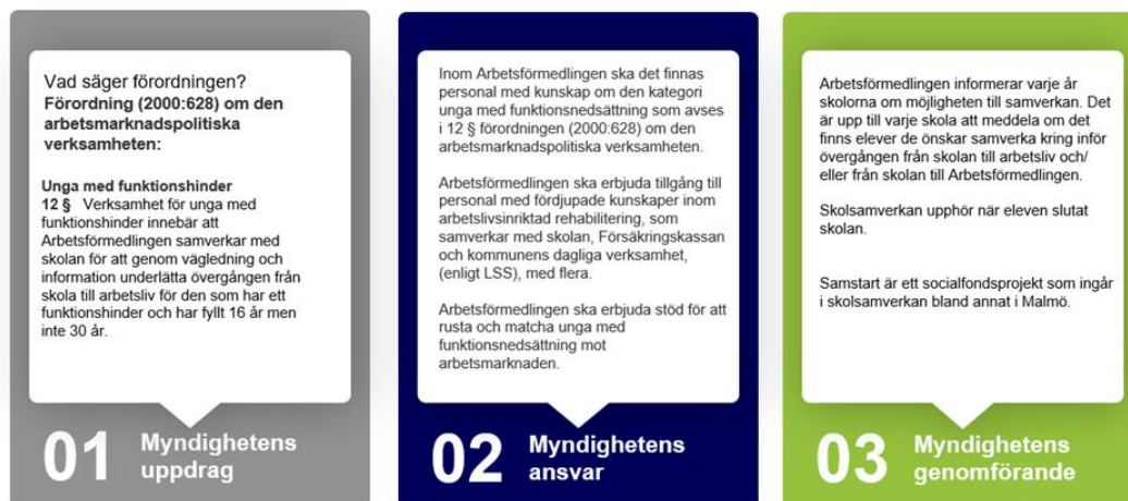
Bild 2: Bilden visar ett så kallat Faktakort. Det aktuella exemplet avser Skolsamverkan. Faktakortet består av tre delar; Myndighetens uppdrag, Myndighetens ansvar och Myndighetens genomförande.

Principen med faktakort kommer från myndighetens tidigare arbeten med kundresor och har fått ett mycket positivt mottagande för sin tydliggörande och beskrivande funktion kopplat till respektive aktivitet.